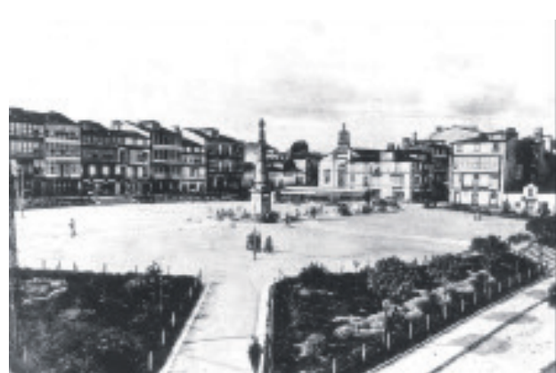
A rúa Real de Ferrol a comezos do século pasado, e na actualidade.