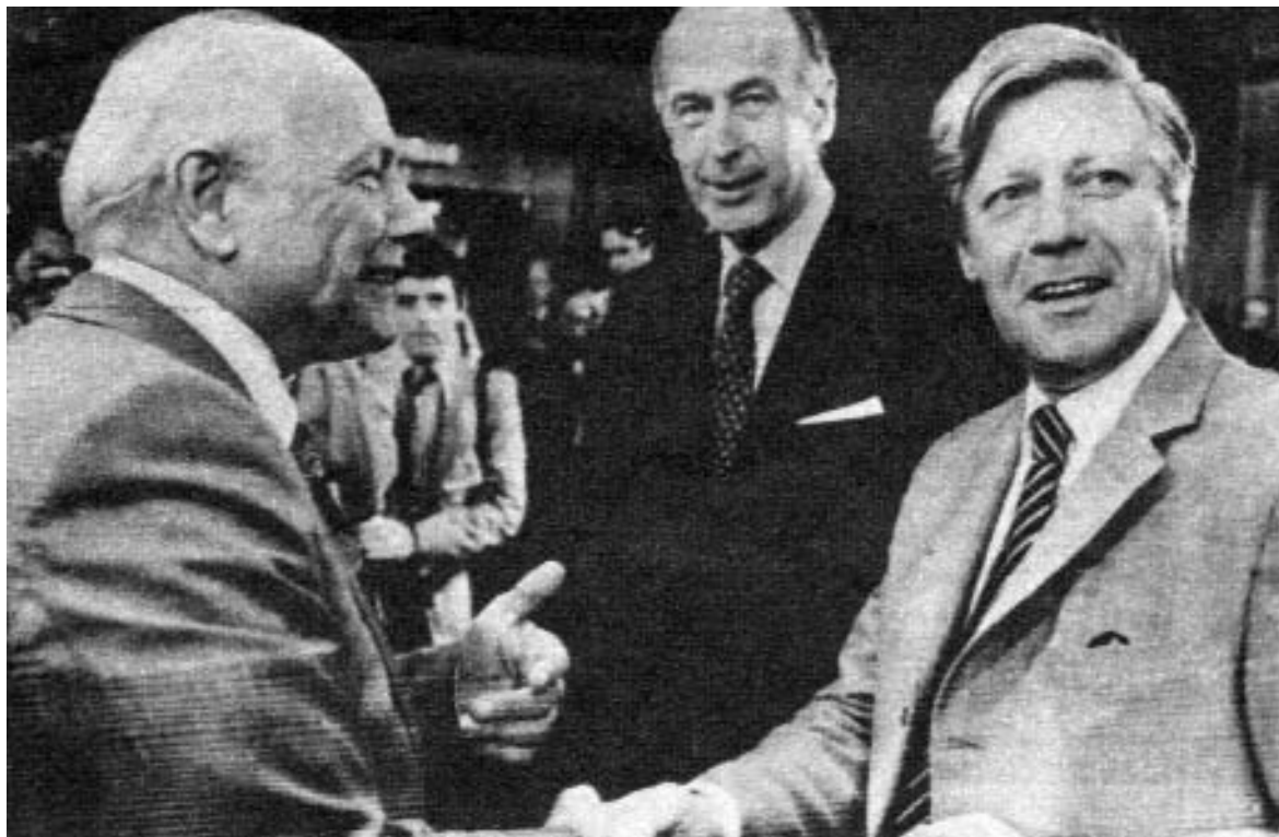
Preparando en Bruselas la “Europa de los pueblos”: El primer ministro holandés, Joop den Uyl, estrecha la mano del canciller Schmidt en presencia del Presidente francés. 1976.

Un observador imparcial dictaminaría que la organización de Naciones Unidas no ha sufrido demasiado daño; más bien, ha ganado en prestigio e influencia, gracias a que los miembros menores del Consejo de Seguridad no han cedido a las presiones de las grandes potencias. Que los conspiradores proclamen la irrelevancia de la ONU sólo agranda la paradoja, dado que nunca como ahora ha invocado la opinión pública mundial el respeto al Derecho internacional y demandado la acción de Naciones Unidas —en secuencia con el relativo éxito de las recientes intervenciones de las mismas en los conflictos de Kuwait (1991), Bosnia (1992-1995) y Timor Oriental (1992-2002). A falta de una fuerza soberana de policía de las Naciones Unidas, pueblos y gobiernos sienten ne-