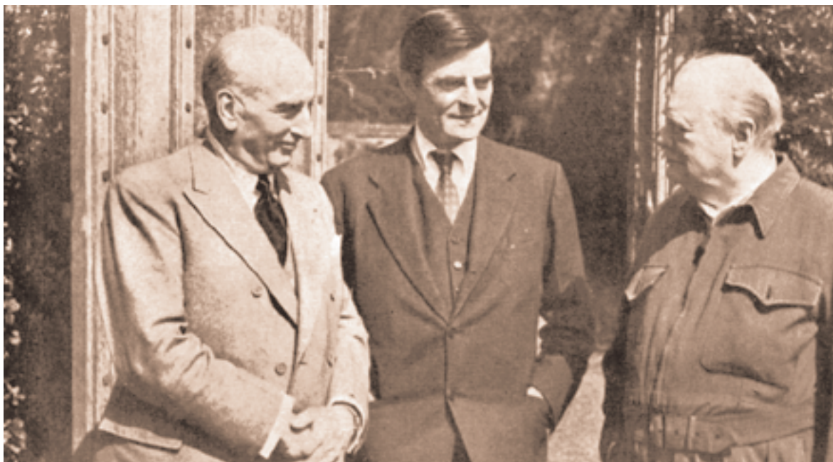
La relación de Europa y EE.UU. en otro momento histórico. El enviado personal del presidente Truman, Davies, fue recibido por el Primer Ministro británico Churchill.

Moralmente consecuentes, como nos tienen acostumbrados, los gobiernos británico, italiano y español, por un lado, boicotean cualquier progreso de constituer Europa más allá de una mera liga in-