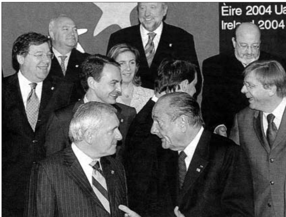
Cumbre europea de 2004. En primer plano a la izquierda Bertie Ahern y Jacques Chirac a la derecha. En segunda fila y de izquierda a derecha, el ministro de Exteriores irlandés, Brian Cowen; Zapatero; el primer ministro esloveno, Anton Rop, y el belga, Verhofstadt. Detrás, Moratinos; la ministra de Exteriores de Luxemburgo, Lydie Polfer, y el ministro belga, Louis Michel. Al fondo Dimitrij Rupel, ministro de Exteriores esloveno.

inmigración se registran algunos avances. La Comisión había diseñado para el derecho de asilo un plan de armonización en dos etapas. El estado de las Directivas aún por aprobar permite suponer que, para junio de 2004, dispondremos de un primer escalón de incipiente armonización legislativa a escala europea en el nivel más bajo de protección.